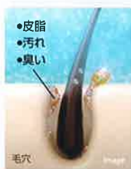
マイクロバブルが汚れや老廃物を吸着し、すっきり洗い流します

1ccに約12,000個の水と空気のできた微細な泡が、肌の隅々の汚れや毛穴の奥の老廃物などを吸着して取り除きます。また、気になる臭いの元をかき出して洗い流します。からだ中の毛穴に入り込んだ微細な気泡が弾ける時に、ほどよい刺激を与えてくれるのでからだの芯から温まり、お風呂上がりに湯冷めしにくく、ゆったりとした温泉気分が味わえます。