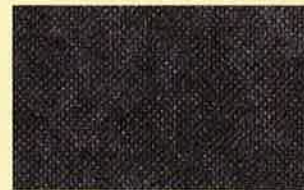
さわやかシート表面